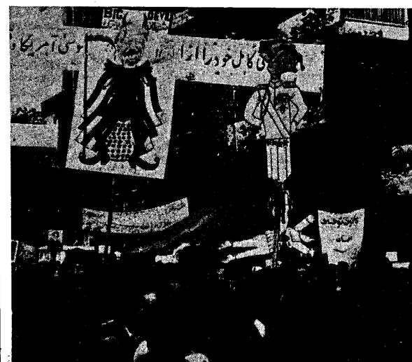
امواج پایان ناپذیر خلقی که علیه امپریالیسم امریکا با خاسته است.

میلیونها نفر شعار میدادند: نبرد با آمریکا شعار ماست امروز